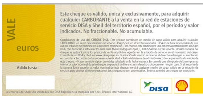
Imagen genérica válida sólo a efectos ilustrativos – cheque sin valor.